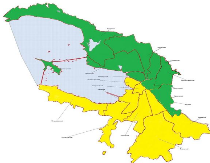
Схема потоков отходов